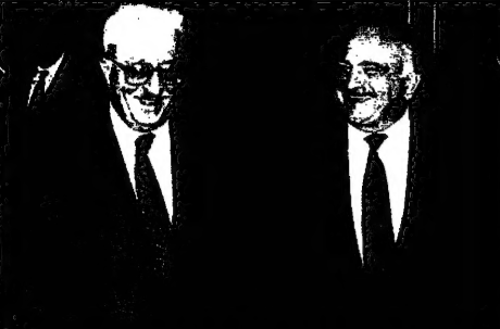
نائب رئيس الوزراء العراقي طارق عزيز مع وزير الخارجية العراقي عزمي بلقفي